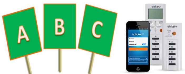
Figura 1 – Exemplos de mecanismos de votação: cartões de resposta (flashcards) com a letras e receptor de radiofrequência USB , sistema remoto de resposta (clicker) e smartphone para a escolha da alternativa em questão.

Usualmente a votação é feita por meio de algum sistema de resposta como flashcards (cartões de resposta) e/ou clickers, espécie de controles remotos individuais que se comunicam por radiofrequência com o computador do professor, ou ainda, quaisquer dispositivos de acesso à internet, tais como notebooks, smartphones e tablets. (figura 1).